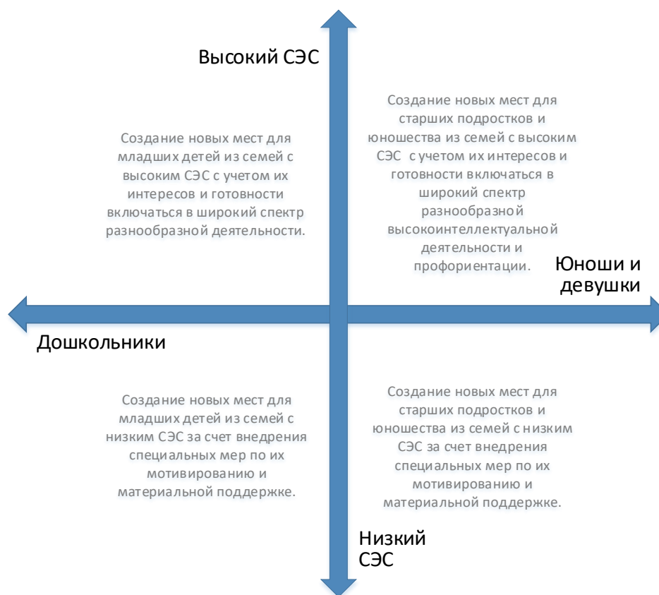
Рис. 5. Шкалы выбора модели создания новых мест по программам технической направленности с учетом особенностей контингента обучающихся

Вовлечение в программы детей из семей с низким образовательным и культурным уровнем потребует осуществления определенных PR-шагов, поиска мотиваторов для данных детей, в том числе материальных.