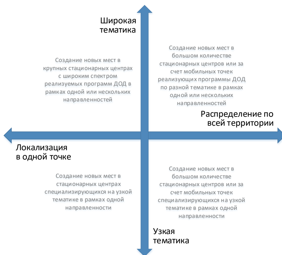
Рис. 3. Шкалы выбора масштаба и формы реализации новых мест по программам ДОД

При невыполнении хотя бы одного из них возникает необходимость пространственного распределения реализуемой модели через мобильные или сетевые решения.