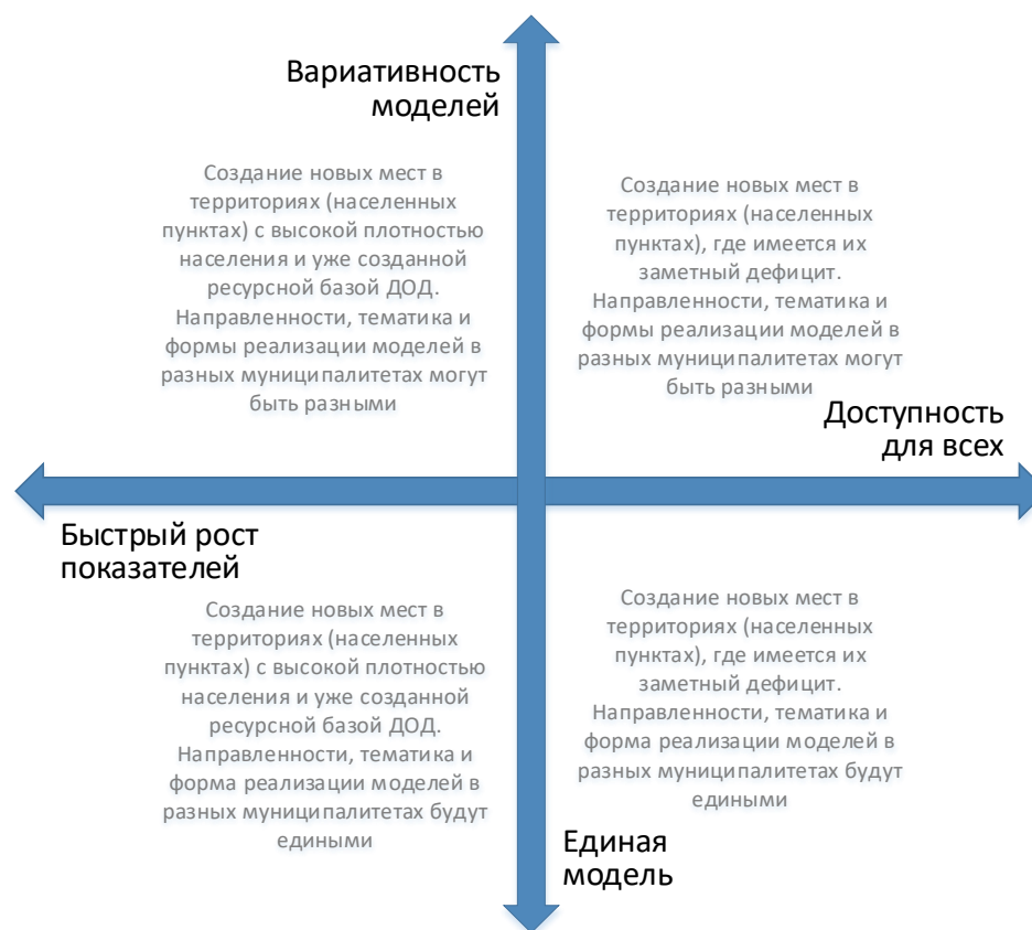
Рис. 4. Шкалы выбора модели создания новых мест с учетом актуальной управленческой политики