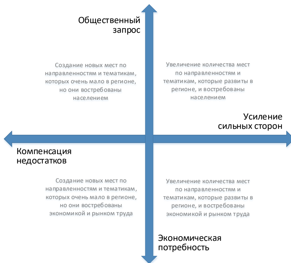
Рис. 2. Шкалы выбора тематики и тактики создания новых мест дополнительного образования