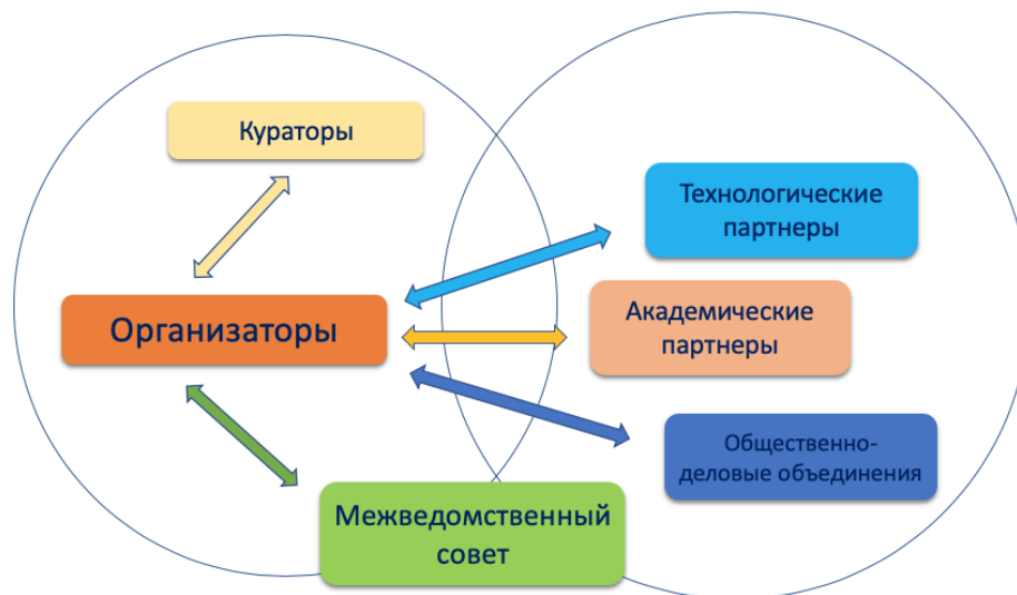
Рис. 1. Схема взаимодействия участников мероприятий по внедрению и функционированию типовой модели «Мейкер»